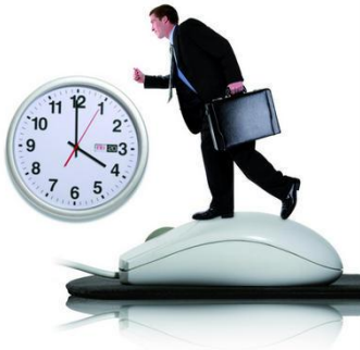
Le forfait n'exonère pas l'employeur de sa responsabilité quant au respect du Code du travail.